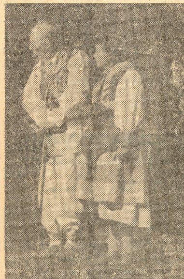
Scena iz komedije „GOSPODSKO DIJETE“ od Kalmana Mesarića