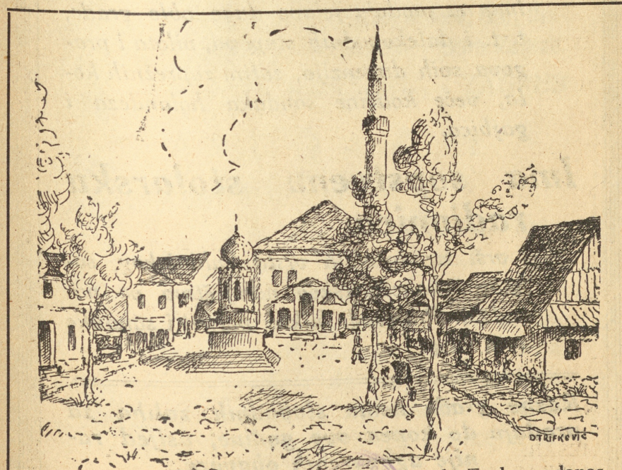
Nekadašnji izgled jednog dijela grada Tuzle — danas