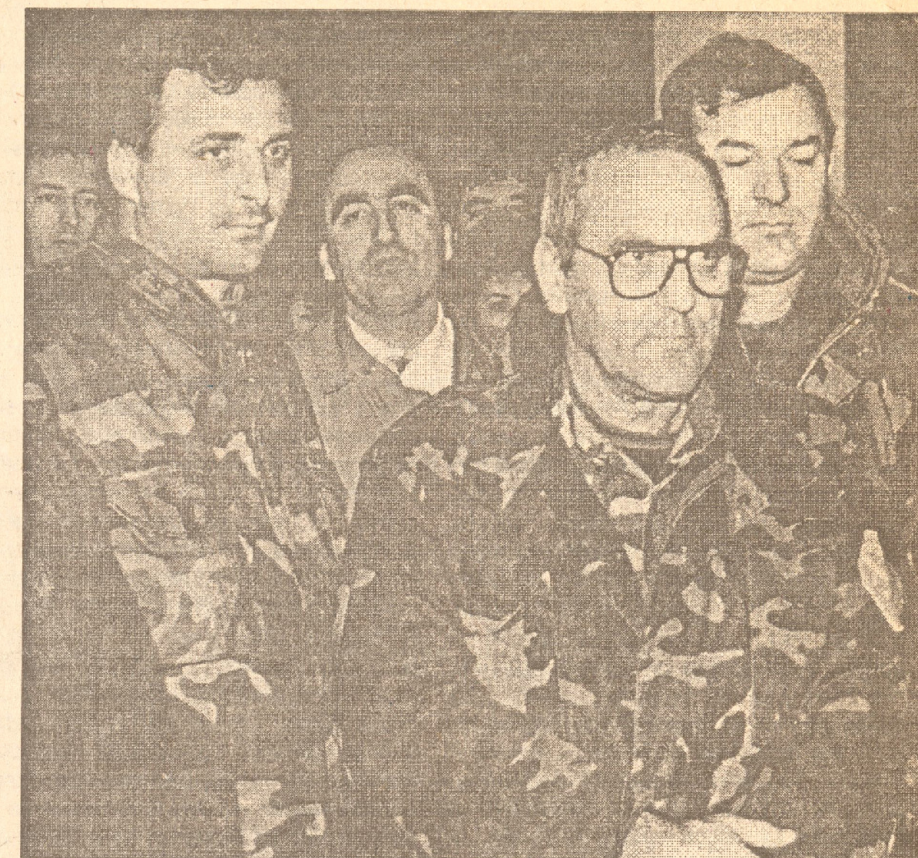
"Bešlagiću, čuvaju leđa..."