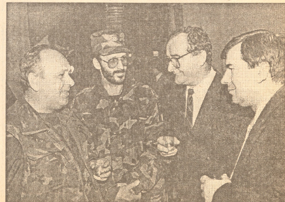
"Pa, nije loš ovaj Glasnik..."