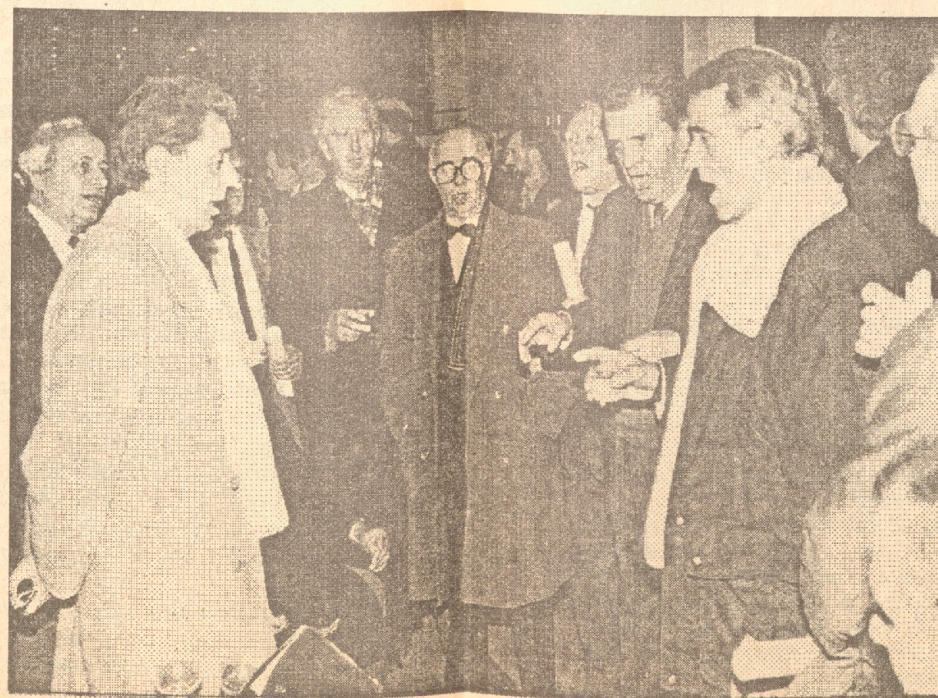
"Lijepa naša ... i be i ha"