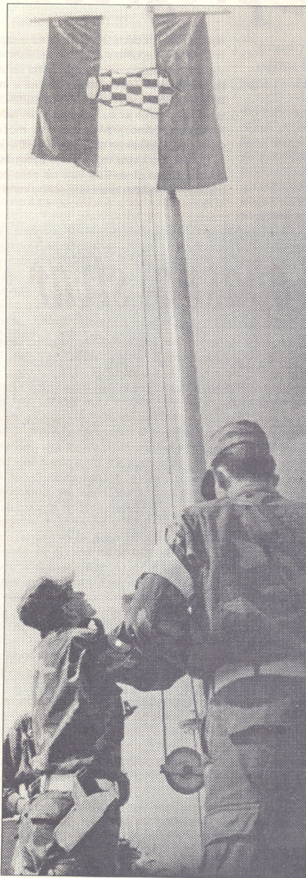
Trenutak za pamćenje