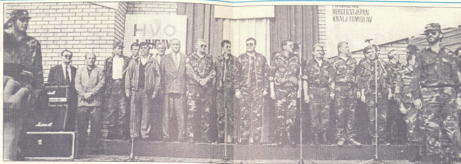
Svečana prisega bojovnika 115. brigade "Zrinski"